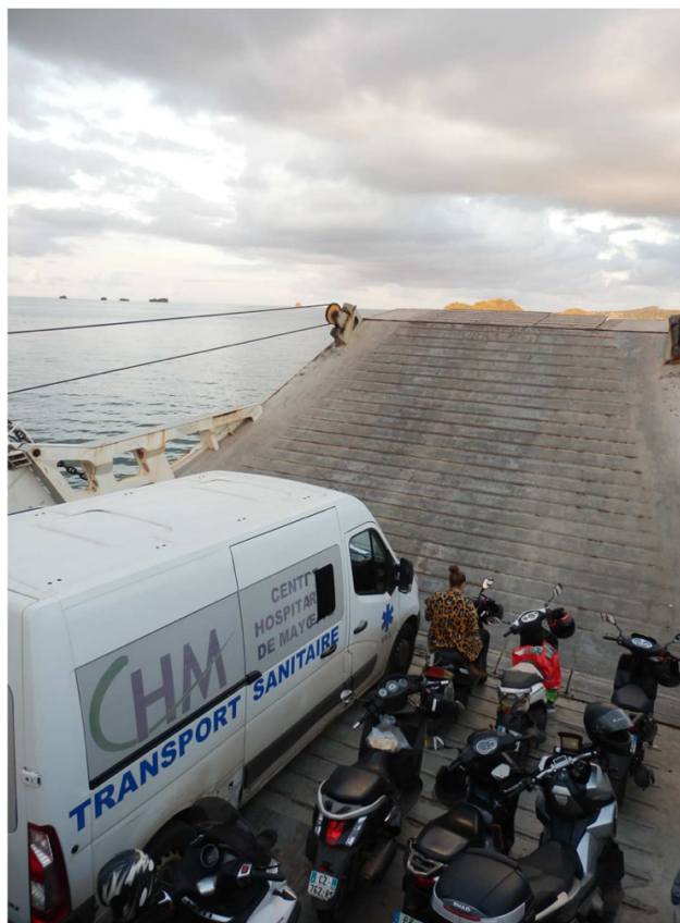
Transport sanitaire, Mayotte